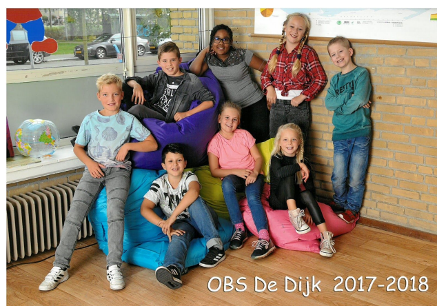
OBS De Dijk 2017-2018