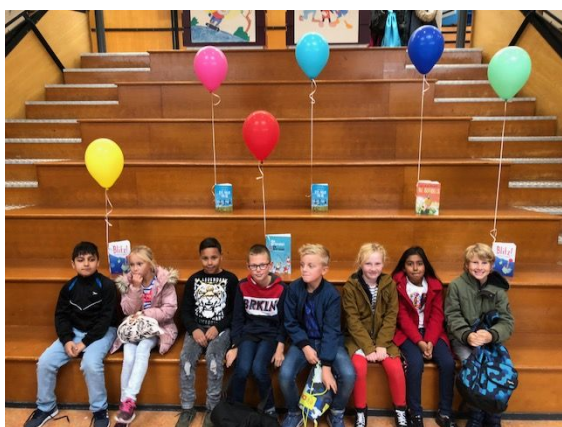
Kinderen uit groep 5 met een deel van de gekozen boeken

Maandag hebben de kinderen de kinderboekenweek geopend met mooie teksten over vriendschap. Op de borden in school kunt u de teksten lezen. Dit is zeker de moeite waard. Natuurlijk kunnen er nog steeds memo's toegevoegd worden. Iedere groep werkt ruim 2 weken uit een gekozen boek. De resultaten kunt u zien tijdens de afsluiting op 18 oktober